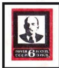
Obr. 112 Celkový padělek. (Mi 239 IIBa).

• Celkový padělek 6-kopějkové známky ze série „Památce V. I. Lenina. Smuteční vydání“ z roku 1924 je na obr. 112. Na první pohled vzbuzují podezření její velice široké okraje, přibližně 4 až 5 mm. Znáмка proto nemůže pocházet z tiskového listu, protože i kdyby byla vystřižena až k obrazu sousedních známek, měla by okraje široké jen asi 3 mm, jak je patrné z obr. 113. Rozdíl je samozřejmě více. Již papír se liší. Pravá známka je vytištěna na papíru o tloušťce 0,06 mm, padělek na papíru tlustém 0,08 mm. Rozdíly jsou i v obrazu známek.