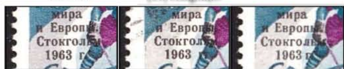
Obr. 106b – zvětšené detaily tří typů přitisku (I–III)

• Druhý průhled: slovní odlišnosti na této známce dvojitý přitisk (při prvním okrají odloží některá odlišuje slovně odlišit v roce 1963 (obr. 107). • Výhled Učastníci ASMR přípravné přitisk na 40-kopějkové známce ze série „160. výročí narození skotského básníka R. Burnse (1759–1796). Byla jí opatřena 40-kopějková známka, vydaná v roce 1957 k připomenutí 160. výročí úmrtí tohoto básníka (obr. 109).