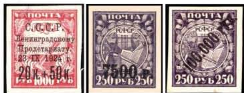
Obr. 101 Obr. 102 Obr. 103

• SSSR 1923. Letecká známka (nevydaná) 5 R (Mi XVII) → SSSR 1923. Letecká známka 10 k (Mi 268) (obr. 104).