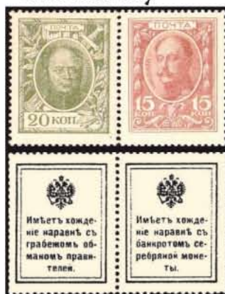
Obr. 110 Celkové padělky ke škodě státu. Převzato z „Ямщик – The Post Rider“, 58/2006 (27-35). Rubový text zde není diverzní.

Padělky mají vzájemně podobit obličejům, málo často podobu a ve vzájemných případech. V Rusku se tak na 1. světové války objevily padělky, které měly být propagandou a motivací stát. Uvedla je do oběhu německá tajná služba. Napodobily známky – peníze. Na vzorku známek 20 k + 15 k (Mi 199 A + Mi 198 A; obr. 110) je na jejich rubové straně divoký text: „Дени в обиду не дам (den v oběhu nebudu)“ (15 k) a „Дени в обиду не дам (den v oběhu nebudu)“ (20 k).