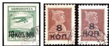
Obr. 104 Obr. 105a, 105b

• SSSR 1925. Výplatní známka 7 k („voják“) → SSSR 1927. Výplatní známka 8 k, vzdálenost mezi řádky přetisku 1,8 mm (Mi A 324 CI) + opakované vydání: SSSR 1928. Výplatní známka 8 k, vzdálenost mezi řádky přetisku 0,8 mm (Mi A 324 CII) (obr. 105a, 105b).