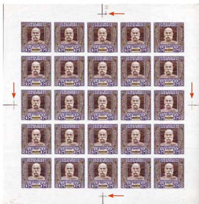
Obr. 1. Kaiserliche Österreichische Post 10 Kronen (1908)

Špeciálna pozornosť bola venovaná najvyššej hodnote 10 KRONEN s aktuálnou podobizňou cisára. Veľký rozmer obrazu známky () si vyžiadala novú formát tlačovej dosky o 25 známkových poliach v usporiadaní 5x5 známok (obr. 1). Vysoké výrobné náklady limitovali aj náklad známky, ktorý bol iba 107 tisíc kusov (4280 tlačových blokov).