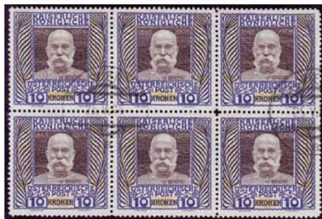
Obr. 4. Známkový blok s výrazným posunom tlače tmavoolivovej farby – hore a dole

prítlačného valca prišlo zrejme k uvoľneniu a posunu posledného radu tlačových štočkov v III. tlačovej doske. V tomto prípade by sa zhodovali kontrolné tri rozmeriavacie kríže zo štyroch. Blok známok na obr. 4 sa javí zatiaľ ako unikátny doklad tlače tejto známky.