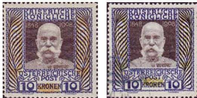
Obr. 3. Známkový blok s výrazným posunom tlače tmavoolivovej farby – hore a dole

Na kontrolu nežiadúceho posunu farieb pri tlači slúžili na každej tlačovej doske 4 rozmeriavacie kríže (vždy uprostred každej strany tlačovej dosky). Označenie tlačových dosiek rímskymi číslicami sa nachádza napravo od horného rozmeriavacieho kríža.