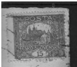
Detail známky 15h L

Dnes se mi jako znalci Slovenského svazu filatelistů dostala do rukou na posouzení pravosti pohlednice se známkou 15h a se zoubkováním 13 \frac{3}{4} : 11 \frac{1}{2} : 11 \frac{1}{2} : 11 \frac{1}{2} . Jedná se o čtvrtou známku, která je nám známa. Pohlednice byla pravděpodobně použita na Pražské poště, zřejmě 16. 10. 1919 nebo 17. 10. 1919 /datum použití vyplývá z napsaného data uvedeném na použité pohlednici / bohužel strojové razítko na uvedené celistvosti je nečitelné. Jedná