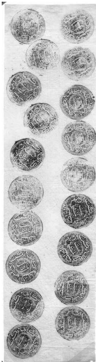
Unikatní arch výplatních známek Afghánistánu z roku 1880

Za redakci Infofile.cz a Merkur-Revue - Zdeněk Jindra