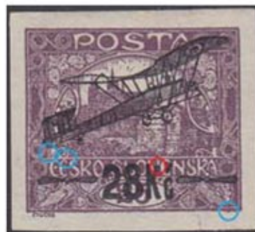
Obr. 3 Poškodenie pravej vrtule v pretlačí u hodnoty L3

Popis ZP 63./I.TD podľa práce [4]: podtyp priečky IIa, E v ČE je spojené s dolnou priečkou, farebný výstupok na dolnom ráme pod pravou holubicou, u ľavej vežičky farebný bod, vejár pravej holubice v tvare (-,-).