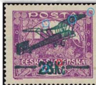
Obr. 4 Dosková chyba pretlače - poškodené K na ZP 63.

Práve v tomto štádiu štúdia leteckých známok z I. pretlačového vydania I. ČSR sa v posledných desaťročiach venovala iba minimálna pozornosť. Poškodenie pravej vrtule v pretlačí u hodnoty L3 je dostatočne zdokumentované už v monografii [1] na str. 14.-15. (obr. 1). Z katalógov uvedenú výraznú doskovú chybu na ZP 79. eviduje iba špecializovaný katalóg [2] ale ju nezobrazuje.