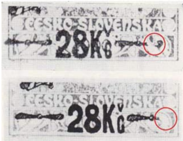
Obr. 1 Poškodenie pravej vrtule v pretlačí u hodnoty L3

Štúdiu leteckých známok z I. pretlačového vydania I. ČSR sa v posledných desaťročiach venovala iba minimálna pozornosť. Poškodenie pravej vrtule v pretlačí u hodnoty L3 je dostatočne zdokumentované už v monografii [1] na str. 14.-15. (obr. 1). Z katalógov uvedenú výraznú doskovú chybu na ZP 79. eviduje iba špecializovaný katalóg [2] ale ju nezobrazuje.