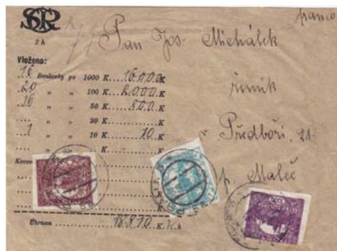
Obr. 5 Fragment oficiálne vydananej obálky, znárodnená podacia pečiatka PRAHA 5, 13. IV. 20

Na obr. 5 je fragment oficiálne vydananej obálky pre peňažnú zásielku v hodnotovom rozsahu 100 Kč (v obálke od 13. IV. 1920). Na die tohto obálky sa používali v tomto čase 100 Kč bankovky, tak ako sa používali v súčasnosti.