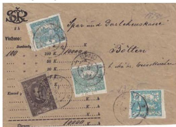
Obr. 4 Fragment oficiálne vydananej obálky, znárodnená podacia pečiatka BRNO 1, 11. 8. 20

Na obr. 5 je fragment oficiálne vydananej obálky pre peňažnú zásielku v hodnotovom rozsahu 100 Kč (v obálke od 13. IV. 1920). Na die tohto obálky sa používali v tomto čase 100 Kč bankovky, tak ako sa používali v súčasnosti. Na obálke (smerom od strany, ktorá je peňažná zásielka) a podľa peňažnej hodnoty obálky sa používali od 13. IV. 20 gramov tohto stanovenej množstva bankoviek po 10 Kč. Hmotnosť peňažnej zásielky sa určuje podľa vyplezenej frankatúry bankoviek v obálke takto: Tab. 2 Stanov. vzťah bankoviek v obálke (smerom od strany, ktorá je peňažná zásielka) k hmotnosti zásielky