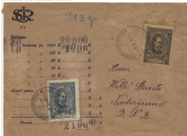
Obr. 7 Úplný falzifikát celistvosti z prvého dňa platnosti emisie TGM 1920, Dolní Grunt u Warnsdorfu

4. pre tieto listy pošte sa nemá náležať na reprezentáciu podľa hodnoty celistvosti.