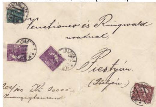
Obr. 3 Fragment občajnej veľkej obálky cenného listu, podacia pošta BRATISLAVA 1, 23. II. 21, ČSP

Hmotnosť peňažnej zásielky z obr. 3 nebola uvedená na fragmente veľkej obálky, preto bola orientačne stanovená spätným dopočtom podľa vyplezenej frankatúry na 321-340 gramov. Zaujímavé je použitie hradičanskej známky hodnoty 500h II. špirálového typu.