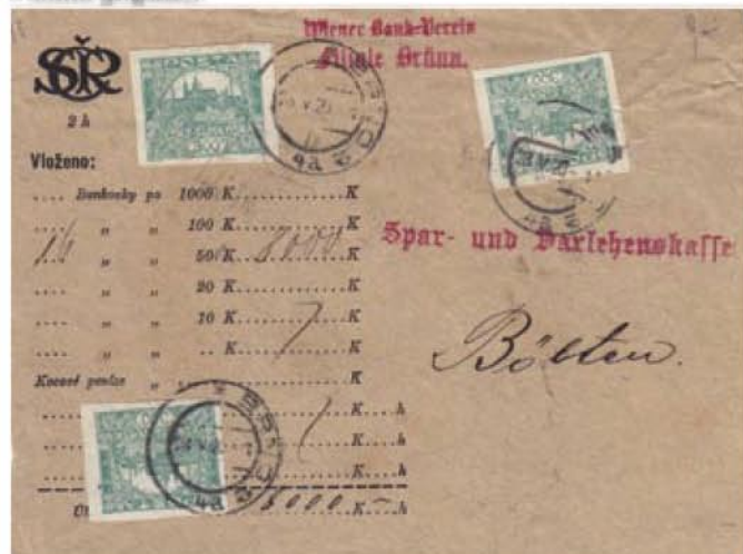
Obr. 2 Fragment oficiálne vydananej obálky, znárodnená podacia pečiatka BRNO 2, 28. V. 20

z II. vydania obálky (1919). V tomto čase obálky sa nepoužívali na označenie množstva bankoviek v hodnotách 100 Kč (v obálke od od 28. 11. 1919). Na die tohto obálky sa používal v tomto čase 100 Kč bankovky, tak ako sa používali v súčasnosti. 1. vzťah: 100 Kč = 1000 K 2. vzťah: 100 Kč = 1000 K